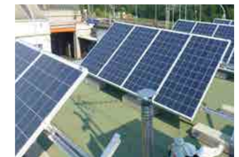
Realiz. Impianti Pannelli Solari