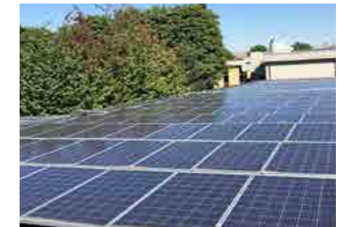
Realiz. Impianti Pannelli Solari