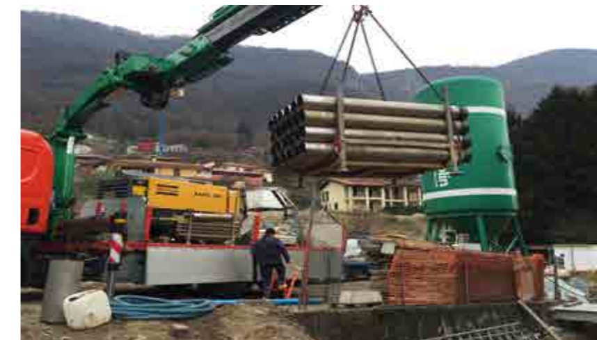
Realizzazione Impianti geotermici a bassa entalpia con sonde di profondità