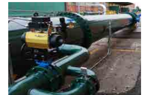
Realiz. piping di grandi dimensioni