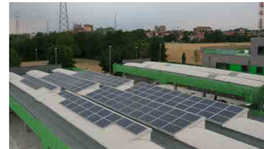
Realizzazione Impianti Pannelli Solari

Individuiamo le migliori soluzioni gestionali e finanziarie volte all' efficientamento energetico e geotermico del building . Il Servizio di consulenza comprende lo studio di fattibilità e di implementazione degli interventi per il risparmio energetico.