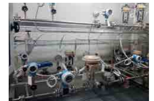
Realiz. Piping skid in container