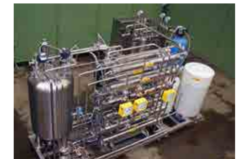
Realiz. Piping skid Inox