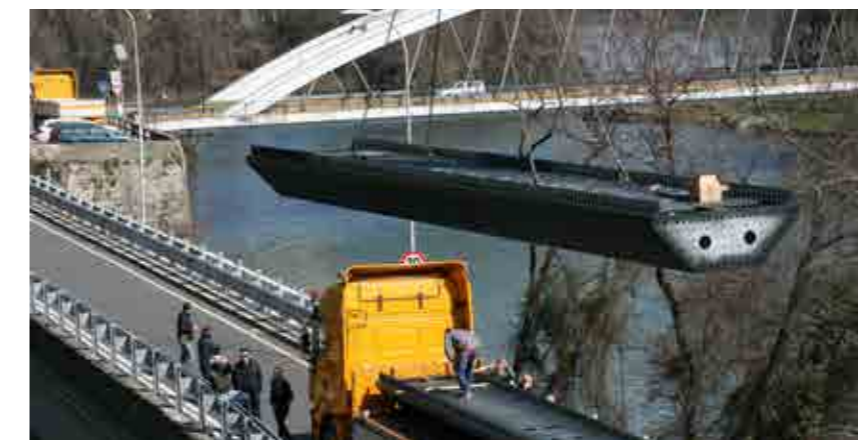
Realiz. di carpenterie media e pesante