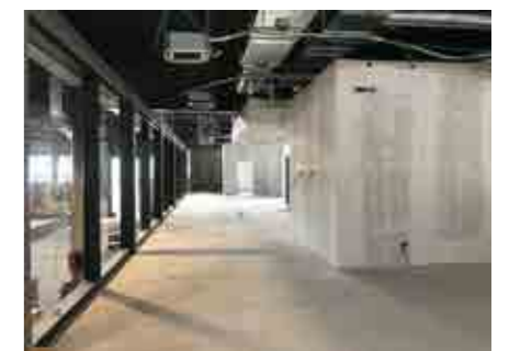
Realiz. di 2.000 mq impianti HVAC