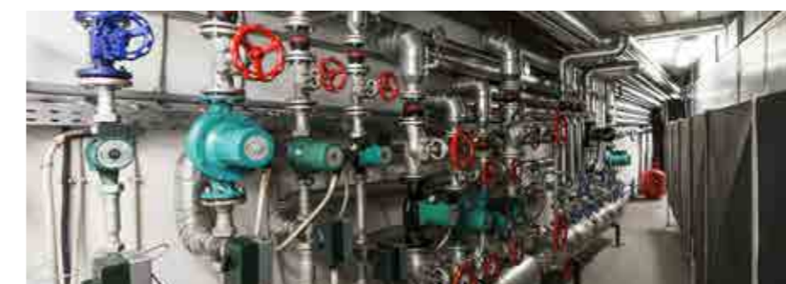
Realizzazione di centrale termofrigorifera - Aulla