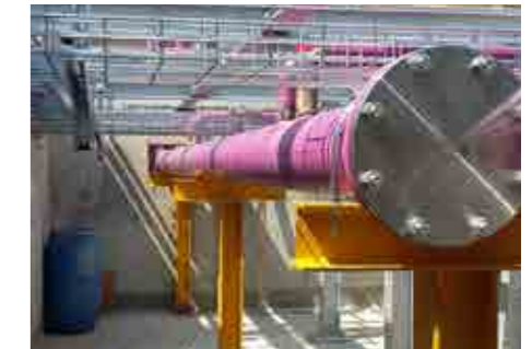
Realiz. Piping di Raffreddamento