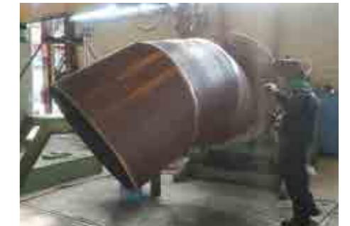
Realiz. Piping di grandi dimensioni

Cosbotek srl è in grado di sviluppare lavori ad alto contenuto tecnologico sempre rispondenti all'esigenze del committente, distinguendosi per il costante e puntuale supporto offerto al cliente in tutte le fasi di esecuzione della commessa.