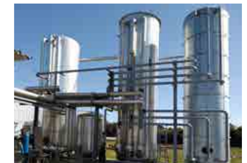
Realiz. Impianti Piping e Silos