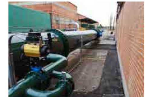
Realiz. Piping di grandi dimensioni