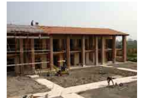
Riqualifica e ampliamento agriturismo