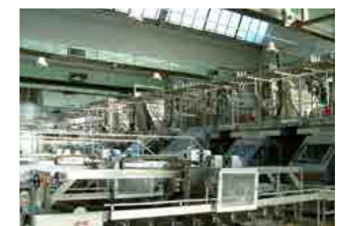
Realiz. / Spost. impianto di prod. autom.